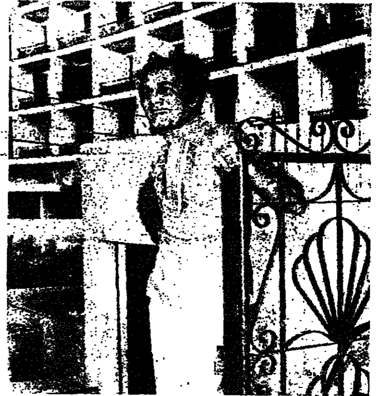
محمود ياسين : للوجه الآخر

ومن لودات السينما المصرية الاوائل كان ذلك المستر محمد عبد الوهاب واشهر افلامه التي اخرجها له محمد كريم «دموع الحب» مع نجاة علي و «يوم سعيد» مع سميحة وسبح و «رصاصه» في القالب «مع راقية ابراهيم واستمرت تلك الموجة تقريبا الى ما بعد الحرب العالمية الثانية ودخلت السينما المصرية مرحلة تاريخها المعاصر تلك المرحلة التي شهدت تباور اتجاهات جديدة لصورة البطل في السينما المصرية ومواصفات خاصة ارسيت قواعدها هوليود وريمت بها كل العالم عن ما هو النجم المطلوب ، او البطل القاسب لشباب الفكر وتكتلت السينما المصرية تلك الرسالة كلعج البر ، وظهر العصر الذهبي لأنور وجدي وليلى مراد ايضا حسين صديقي ، عماد حديقي ، بالإضافة طبعاً الى بعض الابطال الجدد ، لكنهم لم يستمروا طويلاً ايمان احمد سالم ومحمد فوزي وسعد عبد الوهاب ..